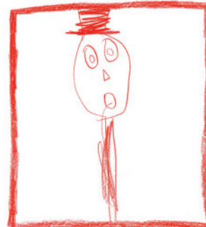
GUL - GEHT, SINGT SCHÖN