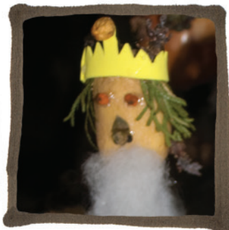
ANA - TROMPETET