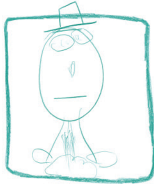
ROTTER - BASS, SINGSANG