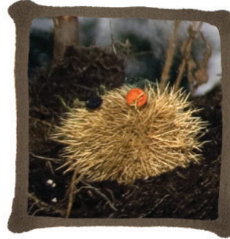
HARDY - GITARRE, GEWINNE