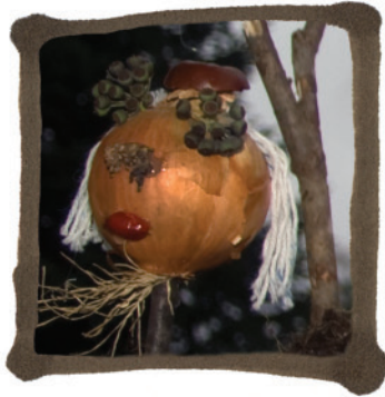
BASTI - GITARRE