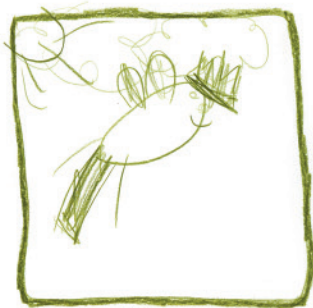
DENIS - SINGT MANCHMAL